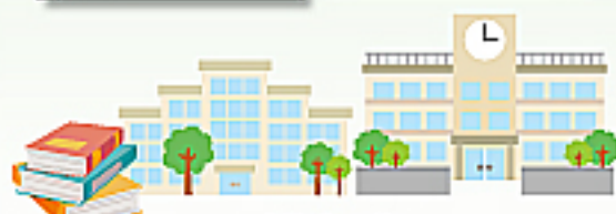
三冬社データ集は