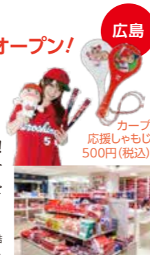
カープ 応援しゃもじ 500円(税込)

カープグッズ、サンフレッチェグッズコーナー 広島といえばカープとサンフレッチェじゃけん! 広島が誇るプロスポーツ!広島東洋カープとサンフレッチェ広島の応援グッズやレアグッズを販売!みんなカープとサンフレを応援しよう!!