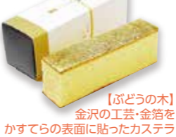
【ぶどうの木】 金沢の工芸・金箔をかすてらの表面に貼ったカステラ 1,080円(税込)

藩政の頃より、金沢が誇る工芸の一つが、「金箔」です。金沢は金箔の99%を生産しており、金沢ならではのこの金箔を贅沢に使用し、豪華な「かすてら」に仕上げました。こだわりの卵「エグロワイヤル」を使用したすっきりとした味わいの「かすてら」です。