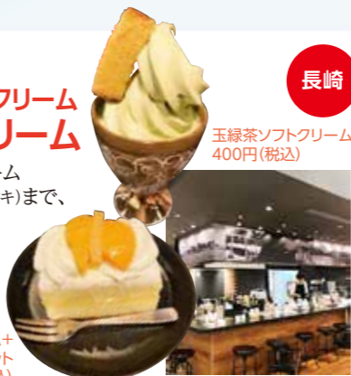
玉緑茶ソフトクリーム 400円(税込)

長崎のお酒からシースクリーム(長崎発祥日本初の生クリームケーキ)まで、首都圏では、ここでしか味わえない長崎の味覚! カフェコーナーも充実。