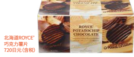
北海道ROYCE' 巧克力薯片 720日元(含税)

ROYCE' 将天然的土豆制成的薯片的咸味和脆脆的口感与巧克力作了完美的调和。咸味中和了巧克力的甜,所以真的是好吃到大家都会一片接一片啊!