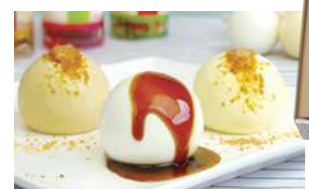
牧家Bocca 牛奶气球布丁 883日元(含税)

著名日本的北海道气球布丁,入口即化似冰淇淋,丝滑弹嫩,回味无穷入奶油,淋上的附赠的焦糖和布丁搭配又将其推上一个新的巅峰,简直就是好吃到想跳舞。