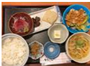
香川オリーブ定食 1,240円(税込) ※ランチのみ。

2F レストラン「かおりひめ」 ランチに、オリーブ豚とオリーブハマチを使った「香川オリーブ定食」を、夜の逸品には、今期初お目見えの「小豆島 島鯉」をはじめ、旬の瀬戸内の海産物やひまわりオイルを使ったメニューが登場します。