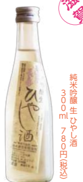
純米吟醸 生ひやし酒 300ml ¥700(税込)

暑い夏には滋賀を代表する池本酒造の「純米吟醸 生ひやし酒」がオススメ!しっかりとしたフルボディのような味わいとリッチ感はお料理との相性抜群。酒本来の山吹色で、香り強めの白ワイのような酸味とキレのバランスの良さが楽しめます。やや辛口タイプで、生酒に嬉しい飲み切りタイプの300mlで販売しております。