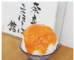
柿氷 500円(税込) 6月~8月(土日祝午後限定)発売

毎年大好評の「柿氷」、今年も期間限定で販売いたします!奈良県産の柿ペーストに吉野くず餅をトッピング。実は柿にはビタミンが豊富に含まれているため、冷たい柿氷を食べれば、暑い夏も元気に過ごせること間違いなしです!奈良のおいしさがたっぷり詰まった柿氷をぜひご賞味ください。